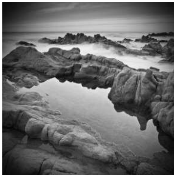
Patrice Clément, Rivage