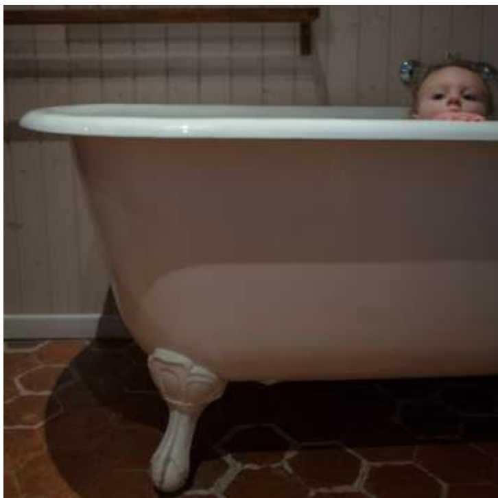
Amandine Suner, Fragments

▪ Images de l'exposition disponibles en haute définition :