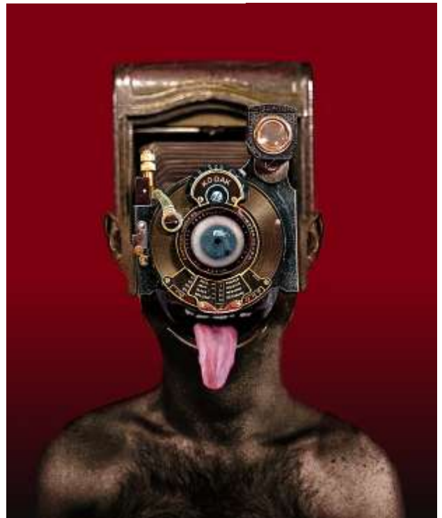
« Càmara Lùcida »