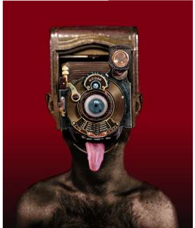
« Càmara Lùcida »