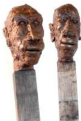
Têtes acier sur douelle de tonneau en bois