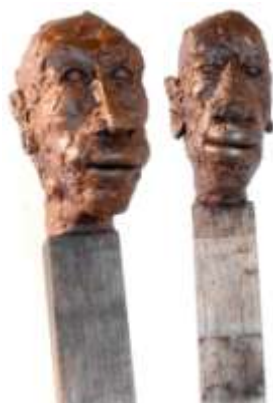
Têtes acier sur douelle de tonneau en bois